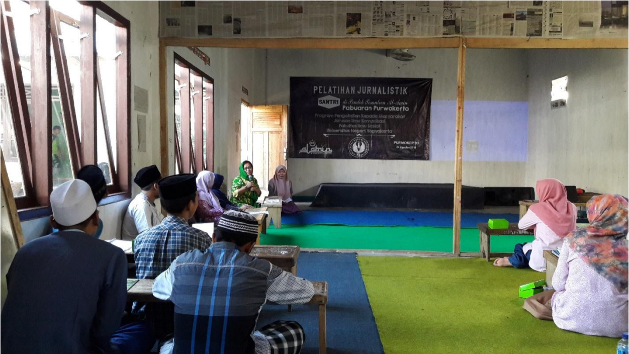
Foto Kegiatan PPM Pelatihan Jurnalistik